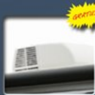
Climatiseur de 13,5K BTU