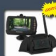
Système de caméra de recul (caméra non incluse)