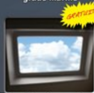
Puits de lumière en haut du bain/douche