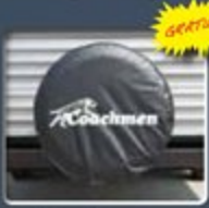
Pneu de secours avec couvert