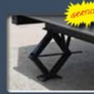
Crics stabilisateurs (4)