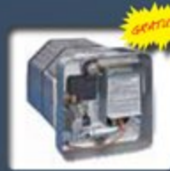
Chauffe-eau DSI gaz/électrique de 6 gallons