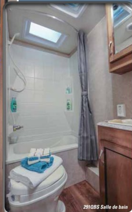
291QBS Salle de bain