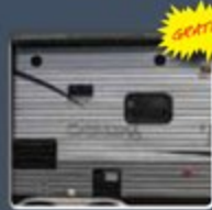
2 haut-parleurs extérieurs de grade marine