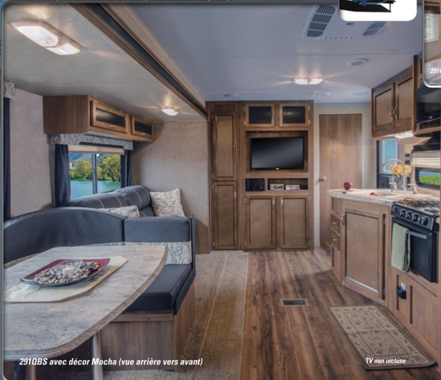
291QBS avec décor Mocha (vue arrière vers avant)