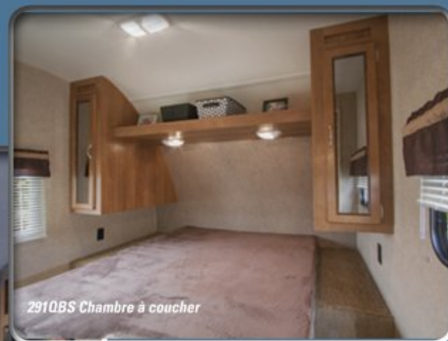
291QBS Chambre à coucher