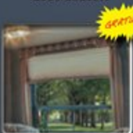
Stores de nuit plissés