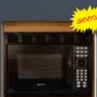
Four micro-ondes avec clavier numérique