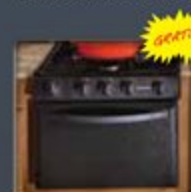
Poêle avec four au lieu d'une cuisinière 3 brûleurs