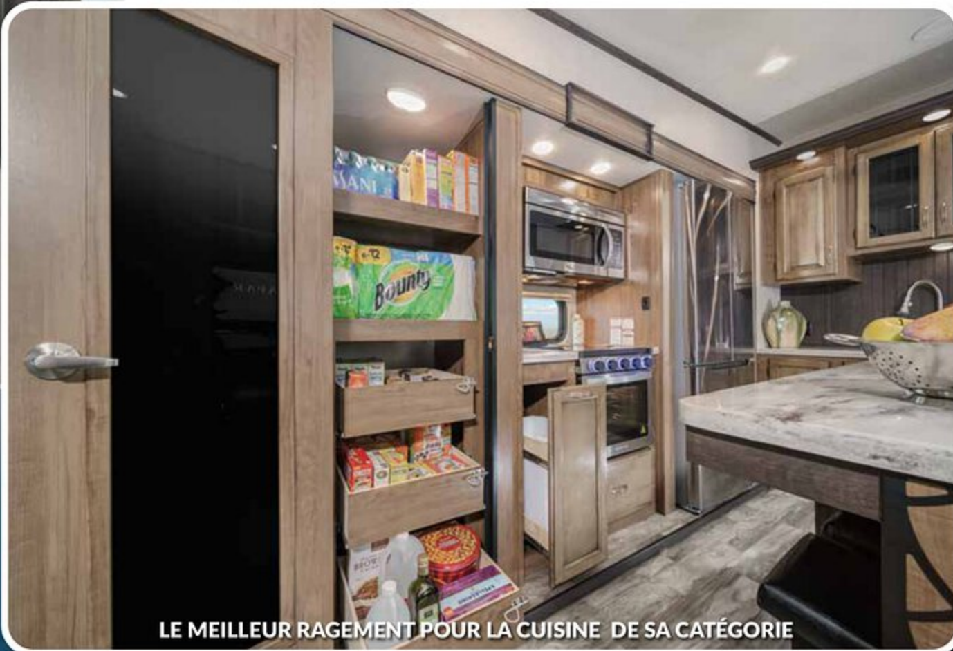
LE MEILLEUR RAGEMENT POUR LA CUISINE DE SA CATÉGORIE