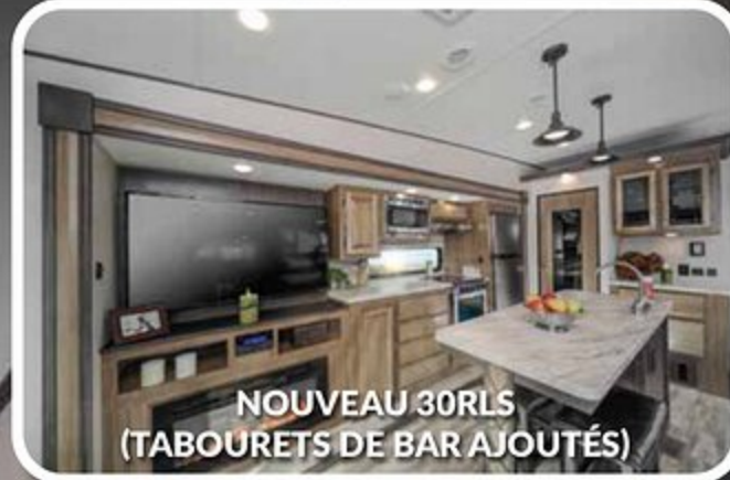
NOUVEAU 30RLS (TABOURETS DE BAR AJOUTÉS)

PRENDRE NOTE QUE CES BROCHURES ONT ÉTÉ TRADUITES EN FRANÇAIS. TOUJOURS SE REPORTER À LA BROCHURE EN ANGLAIS DU MANUFACTURIER. L'INFORMATION CONTENUE DANS CETTE BROCHURE EST CELLE CONNUE AU MOMENT DE LA PUBLICATION. TOUTEFOIS, PENDANT L'ANNÉE, IL PEUT ÊTRE NÉCESSAIRE DE FAIRE DES RÉVISIONS ET FOREST RIVER INC SE RÉSERVE LE DROIT DE FAIRE TOUT CHANGEMENT, SANS PRÉAVIS, AUX PRIX, COULEURS, MATÉRIAUX, ÉQUIPEMENTS ET SPÉCIFICATIONS, AINSI QUE L'AJOUT DE NOUVEAUX MODÈLES ET L'ABANDON DE MODÈLES MONTRÉS DANS CETTE BROCHURE. AINSI, VEUILLEZ CONSULTER VOTRE CONCESSIONNAIRE FOREST RIVER ET CONFIRMEZ L'EXISTENCE DE TOUT MATÉRIAU, DESIGN OU SPÉCIFICATION IMPORTANTS À VOTRE DÉCISION D'ACHAT. * = OÙ DISPONIBLE TRADUIT PAR CLAUDE M DECHENE CLAUDEMILLEDECHENE@GMAIL.COM