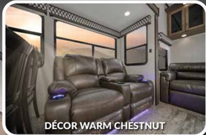
DÉCOR WARM CHESTNUT

Voici 20.000 pieds carrés qui vous offrent une assurance de qualité. La base essentielle d'un produit de haute qualité. Cette installation de pointe fait ses commentaires de façon quotidienne et immédiate à la production afin de s'assurer de la qualité de construction de chaque unité produite.