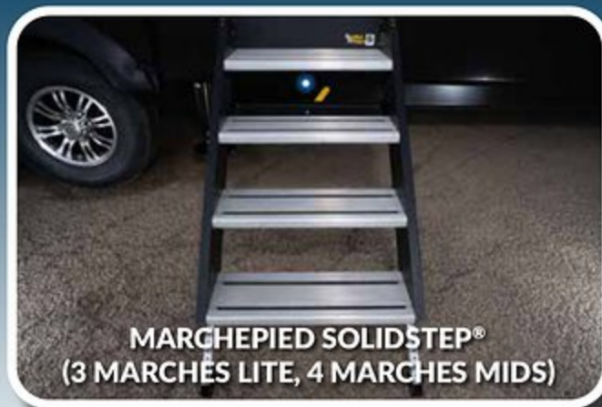
MARGHEPIED SOLIDSTEP® (3 MARCHES LITE, 4 MARCHES MIDS)