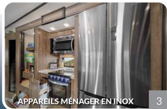
APPAREILS MÉNAGER EN INOX