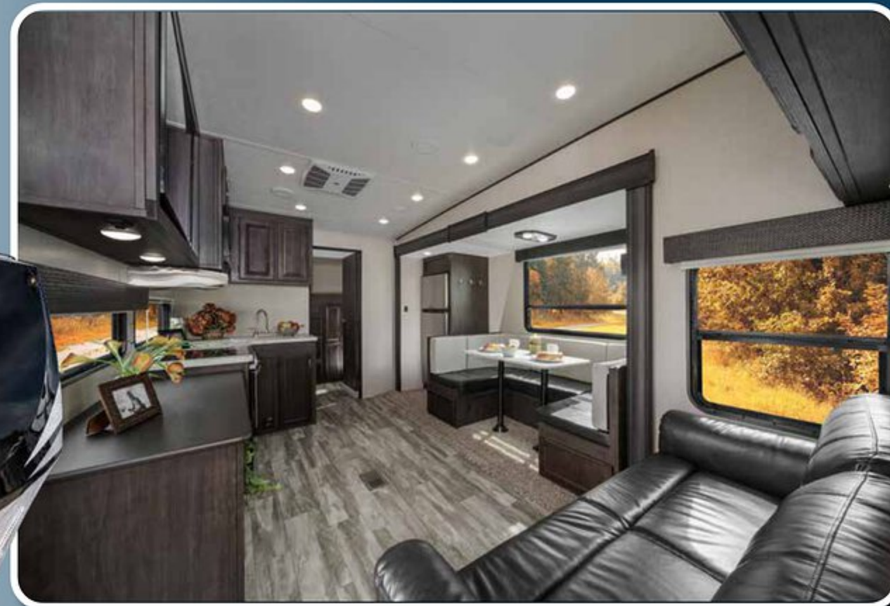
TOUT NOUVEAU 274X-LITE AVEC DÉCOR CHARCOAL