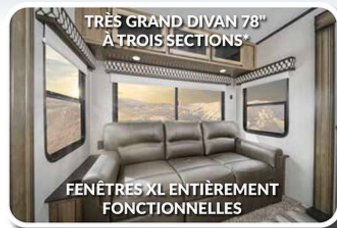
TRÈS GRAND DIVAN 78" À TROIS SECTIONS*