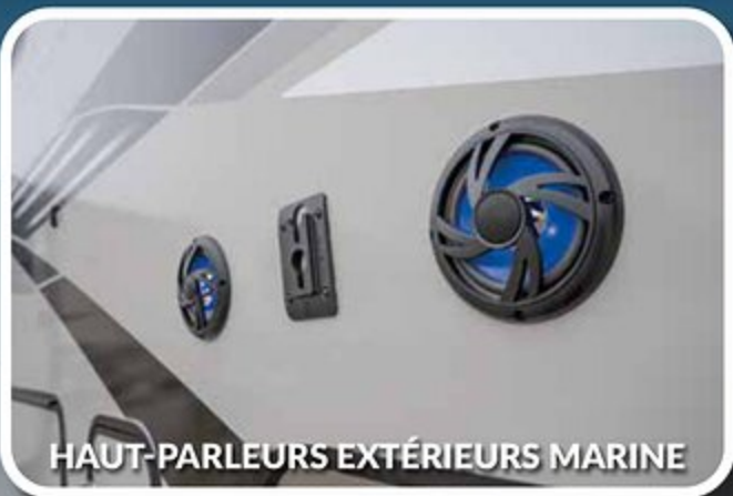
HAUT-PARLEURS EXTÉRIEURS MARINE