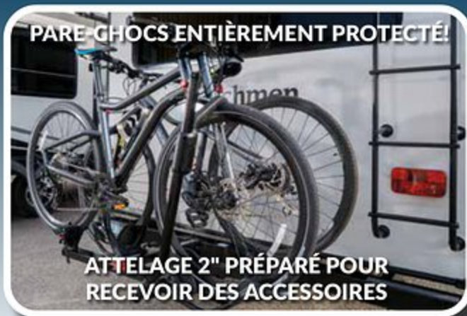
PARE-CHOCS ENTÈREMENT PROTÉGÉ!