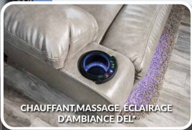
CHAUFFANT, MASSAGE, ÉCLAIRAGE D'AMBIANCE DEL*