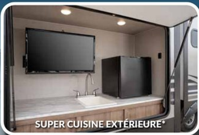
SUPER CUISINE EXTÉRIEURE*