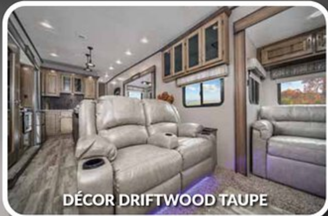
DÉCOR DRIFTWOOD TAUPE