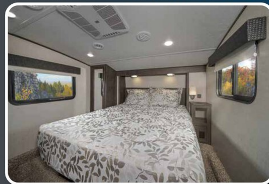
CHAMBRE DES MAÎTRES X-LITE AVEC LIT QUEEN 60X80