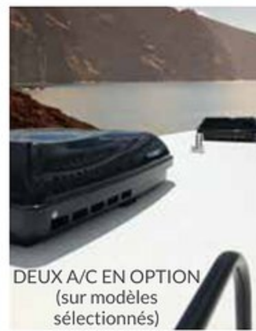
DEUX A/C EN OPTION (sur modèles sélectionnés)