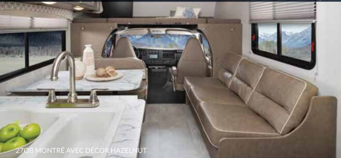
27QB MONTRÉ AVEC DÉCOR HAZELNUT