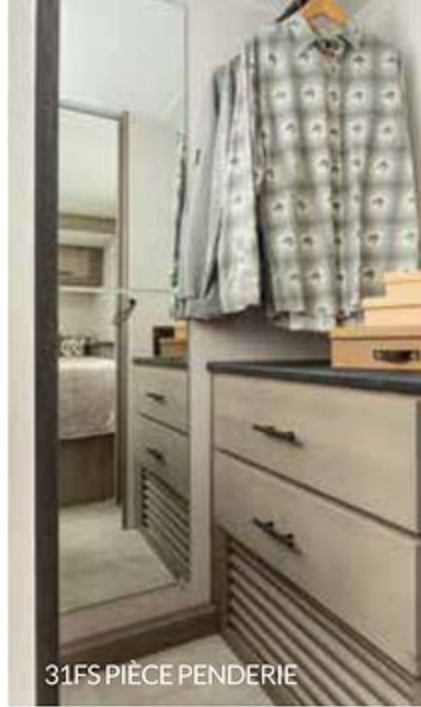
31FS PIÈCE PENDERIE