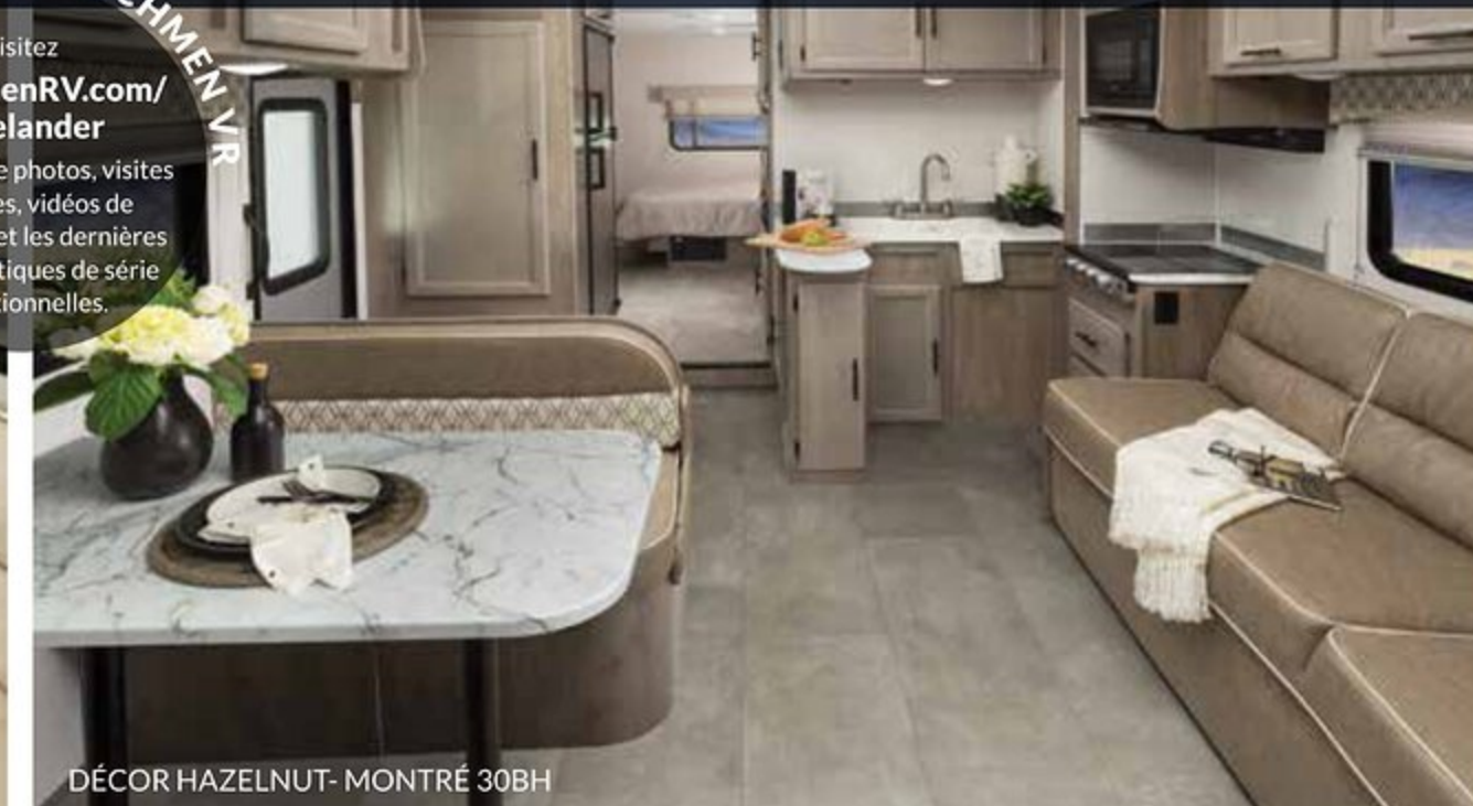
DÉCOR HAZELNUT- MONTRÉ 30BH