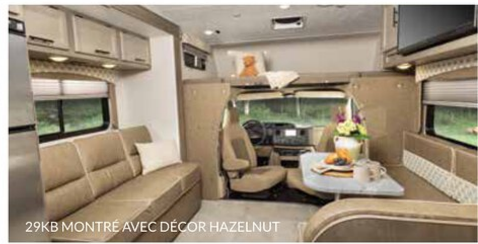
29KB MONTRÉ AVEC DÉCOR HAZELNUT