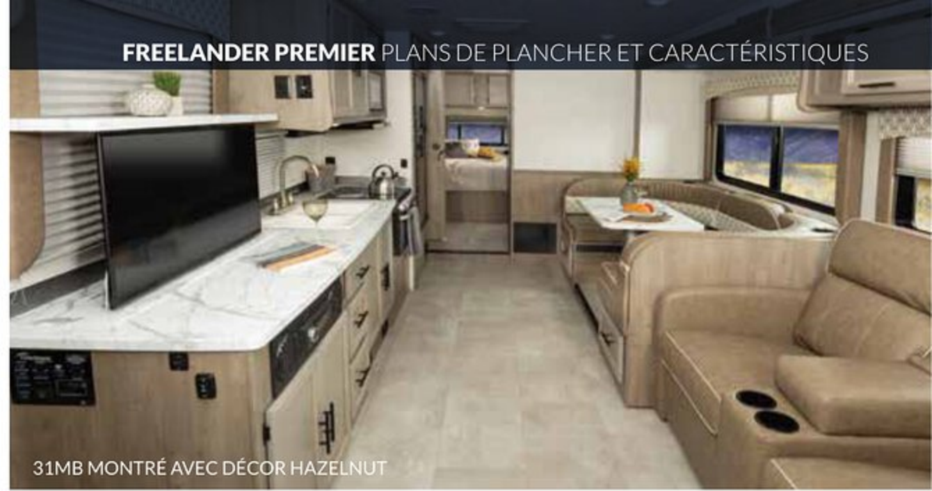
31MB MONTRÉ AVEC DÉCOR HAZELNUT