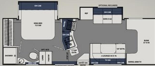
29KB PLAN DE PLANCHER AVEC LIT KING