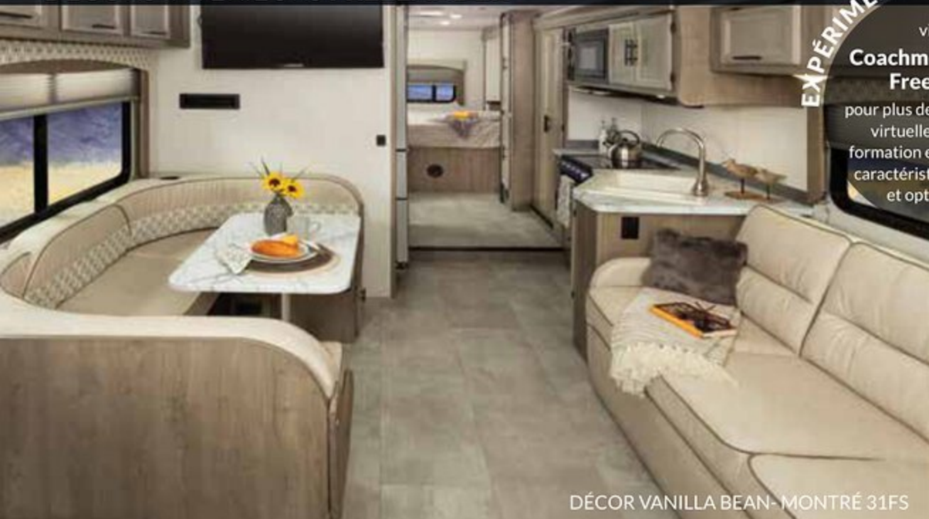
DÉCOR VANILLA BEAN- MONTRÉ 31FS