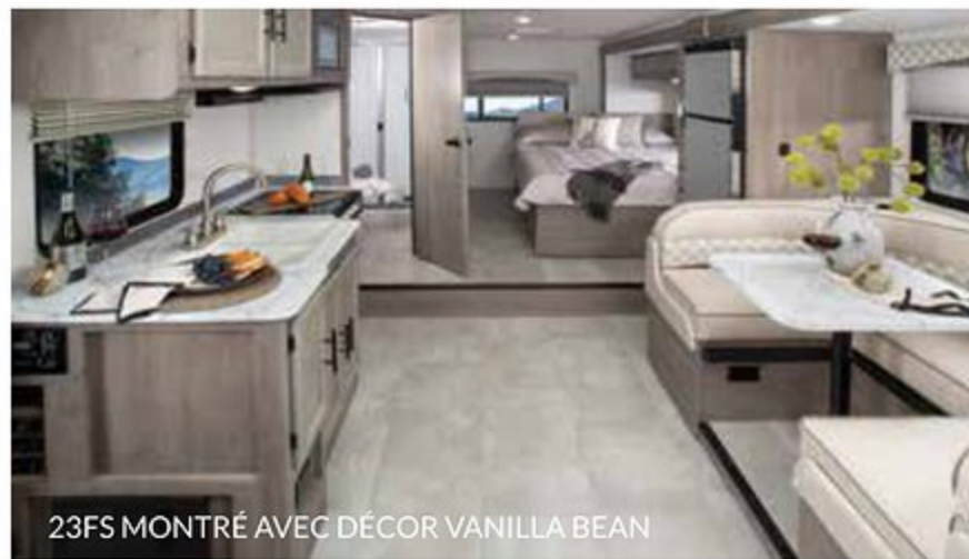
23FS MONTRÉ AVEC DÉCOR VANILLA BEAN