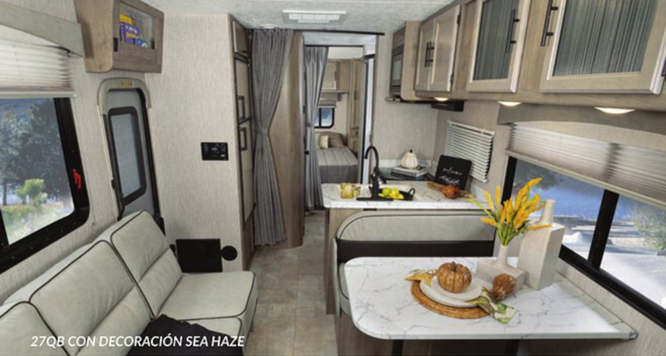
27QB CON DECORACIÓN SEA HAZE