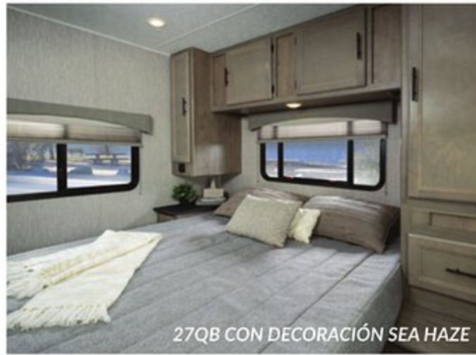
27QB CON DECORACIÓN SEA HAZE