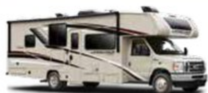
CHÂSSIS DE CABINE PENTURÉ