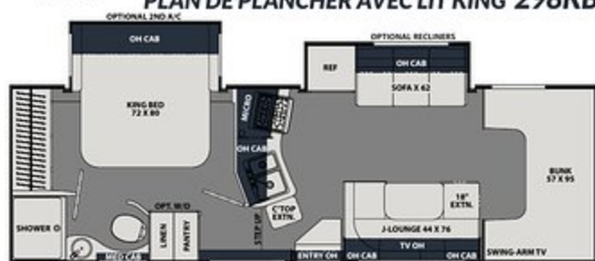
PLAN DE PLANCHER AVEC LIT KING 298KB