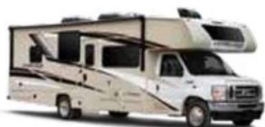
ENSEMBLE DE GRAPHIQUE DE SÉRIE