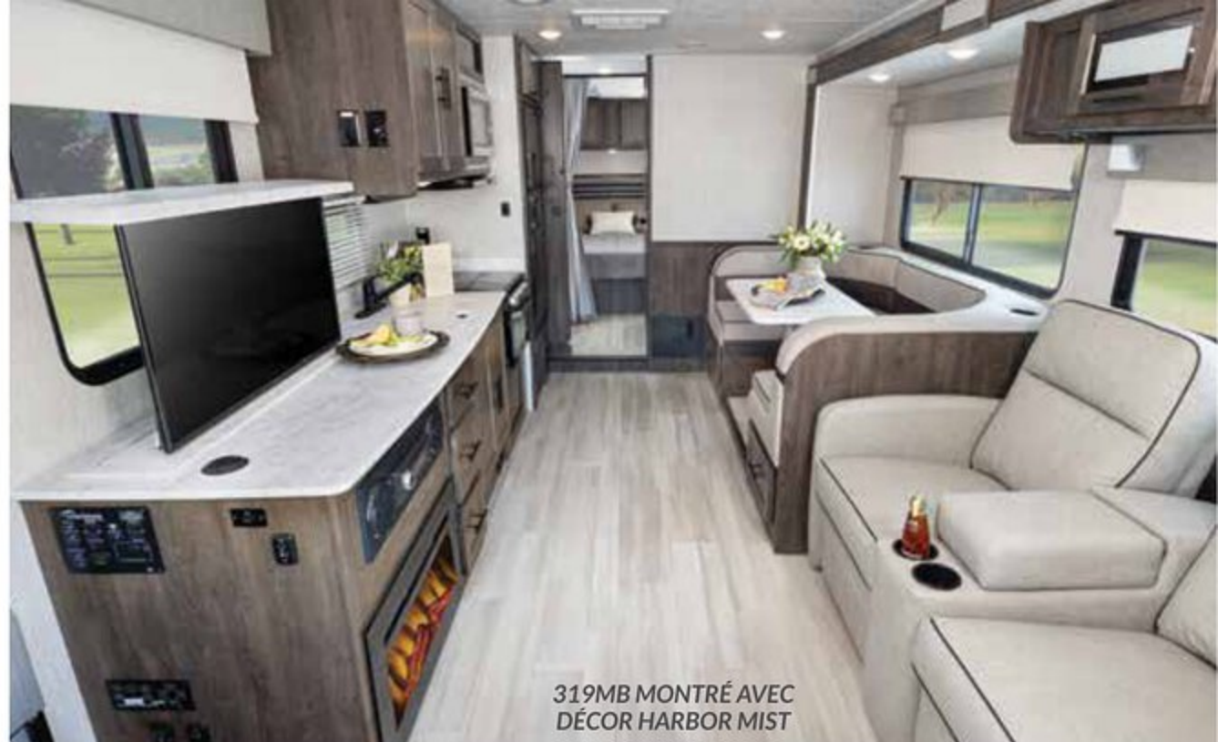
319MB MONTRÉ AVEC DÉCOR HARBOR MIST