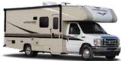
GRAPHIQUES DE SÉRIE