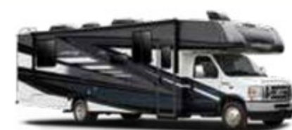
OPTION PEINTURE COMPLÈTE STEEL