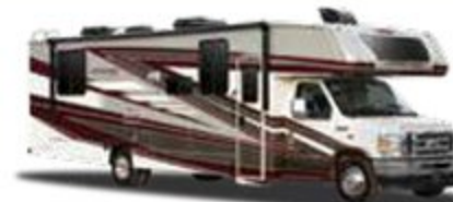
OPTION PEINTURE COMPLÈTE STARFIRE