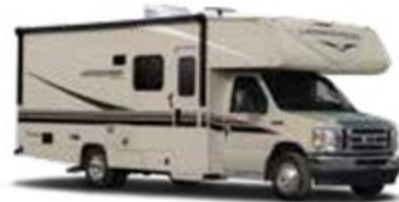
CHÂSSIS DE CABINE PENTURÉ