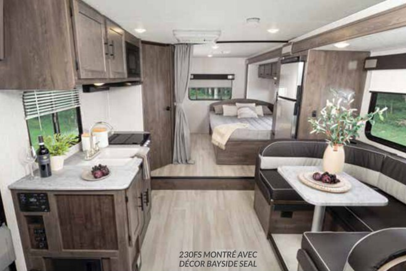
230FS MONTRÉ AVEC DÉCOR BAYSIDE SEAL