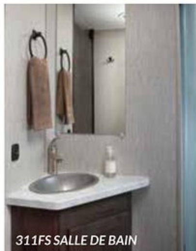
311FS SALLE DE BAIN