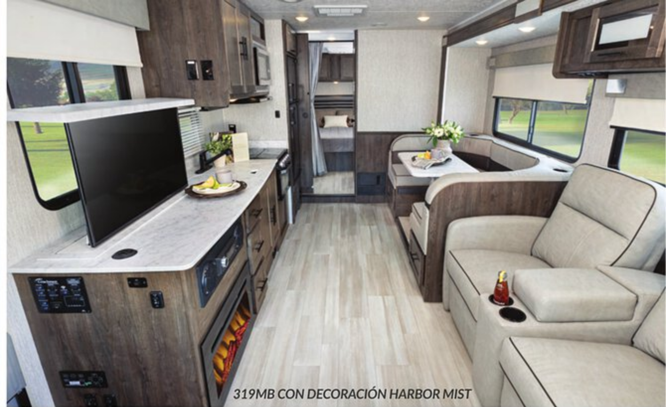
319MB CON DECORACIÓN HARBOR MIST