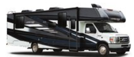
PINTURA COMPLETA OPCIONAL STEEL