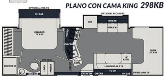
PLANO CON CAMA KING 298KB