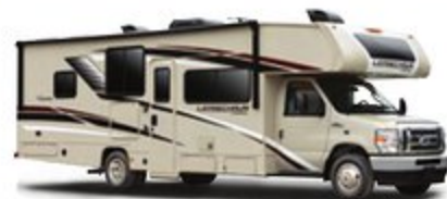
CABINA DE CHÁSIS PINTADA