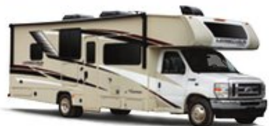
PAQUETE DE GRÁFICOS ESTÁNDAR