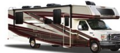
PINTURA COMPLETA OPCIONAL STARFIRE