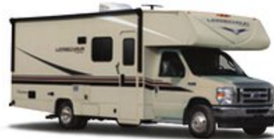
CABINA DE CHÁSIS PINTADA