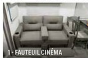
1 - FAUTEUIL CINÉMA