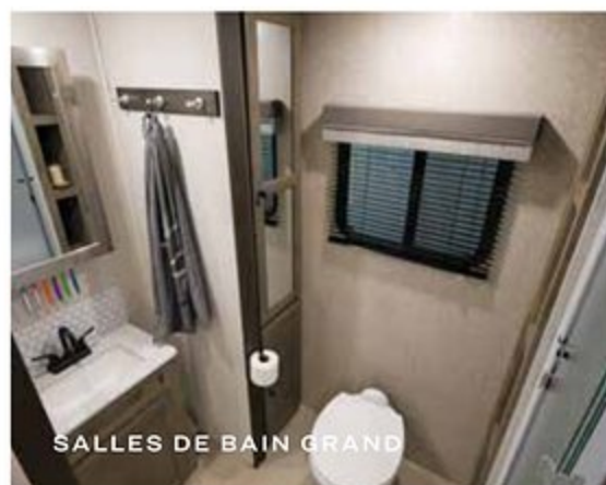
SALLES DE BAIN GRAND

"NOUS NE VOYAGEONS PAS POUR ÉCHAPPER À LA VIE, MAIS POUR QUE LA VIE NE NOUS ÉCHAPPE PAS."