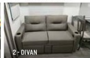
2 - DIVAN