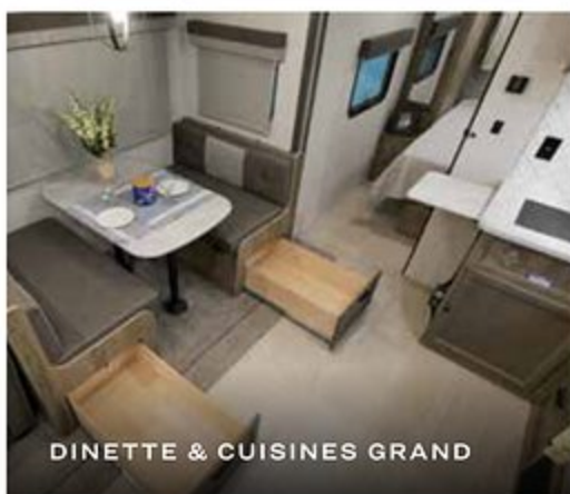
DINETTE & CUISINES GRAND