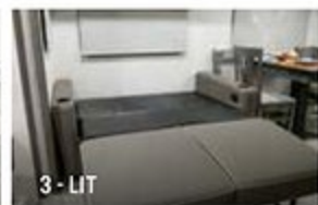
3 - LIT

... Pour faire du Neuf avec du vieux! Le changement remonte à nos racines de près de 20 ans. Nous pensons que c'est le prêt-à-camper de luxe "GRAND" à son meilleur, bienvenue dans votre Caravane 5 étoiles!