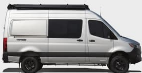
Équipement extérieur de série