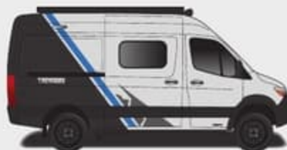
Peinture partielle Aztec (Fourgonnette argent seulement)