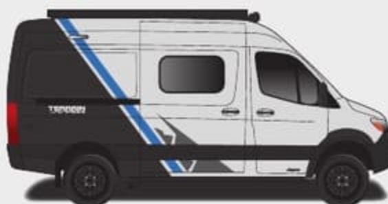
Peinture partielle Aztec (Fourgonnette argent seulement)