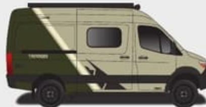
Peinture partielle Forest Glade (Fourgonnette Sandstone seulement)