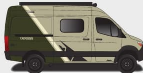
Peinture partielle Forest Glade (Fourgonnette Sandstone seulement)