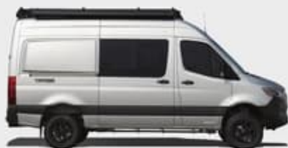
Équipement extérieur de série