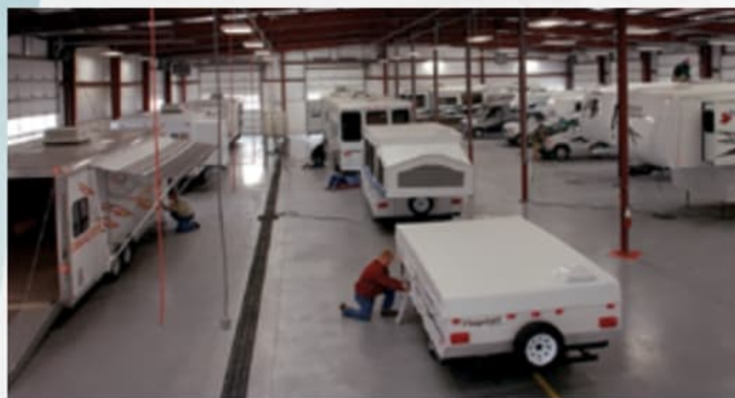
CENTRE DE VÉRIFICATION AVANT LIVRAISON

Voici 20 000 pieds carrés qui vous offrent une assurance de qualité. La base essentielle d'un produit de haute qualité. Cette installation de pointe fait ses commentaires de façon quotidienne et immédiate à la production afin de s'assurer de la qualité de construction de chaque unité produite.